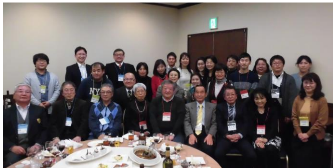
(新年会終了後の集合写真です。)

会の途中で催されるビンゴ大会では、周りがどんどん北里大学グッズを手にしていて、袋から取り出すたびに、こんなグッズもあるのかと驚きながら、自分も何か当たるのかなど期待していました。今回私は、なんと単身赴任の味方「八雲牛ビーフシチューレトルトパック」をいただくことができました。八雲牛のことを全く知らなかったの、相模原キャンパス以外のことを想像するだけで、北里大学の大きさを感じることができました。👉3