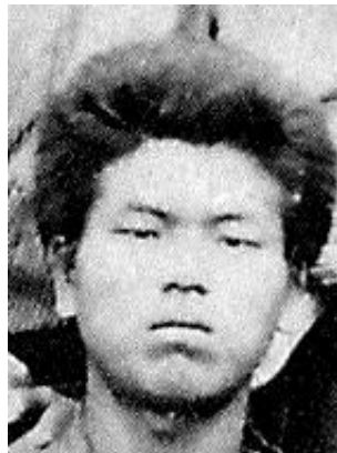
図1 青年期の北里柴三郎 意思の強さを感じさせる

右の写真はそれを切り出したものです(図1)。熊本医学校時代(20歳頃)のものでした。周囲を圧倒していたのはその「目」と「口元」であり、意思の強さと強い決意とを発散させています。この顔は我々が見慣れた学祖北里柴三郎とは明らかに違って見えます。