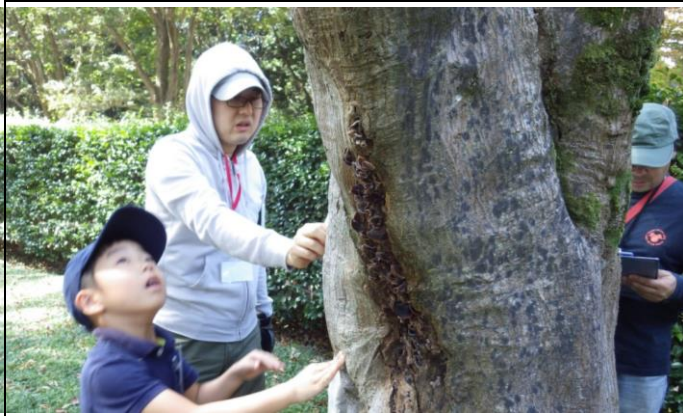
図3. 野外のキノコ観察会の様子