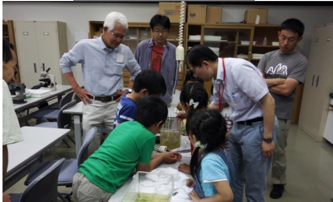
図4. 田んぼの生き物・顕微鏡観察