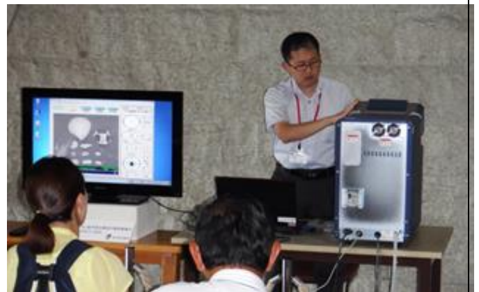
図 2. ミクロの世界探検の様子

博物館では毎月第 3 日曜日に「県博デー」ということで、積極的に楽しいイベントを開催しています。午前中は各種外部団体によるコンサートや発表会、午後は当館学芸員のとおき講座を開催しています。私は電子顕微鏡を使った「ミクロの世界探検」という講座 (年に 6 回程度) を担当しています (図 2)。