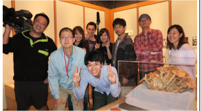
図 1. 日テレの every の皆さん

私はキノコの研究にも力を入れています。2016 年秋に自身初となる「キノコの不思議」展を開催でき、展示の内容を新聞 (東京新聞、下野新聞)、雑誌 (ニュートン)、テレビ (日テレ、とちぎテレビ、宇都宮ケーブルテレビ) など多くのメディアに取り上げて頂きました。特に反響が大きかったのは、日テレの every の生放送で芸能人の渡辺裕太さんと出演できたことです (図 1)。